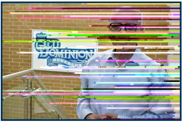
A N F